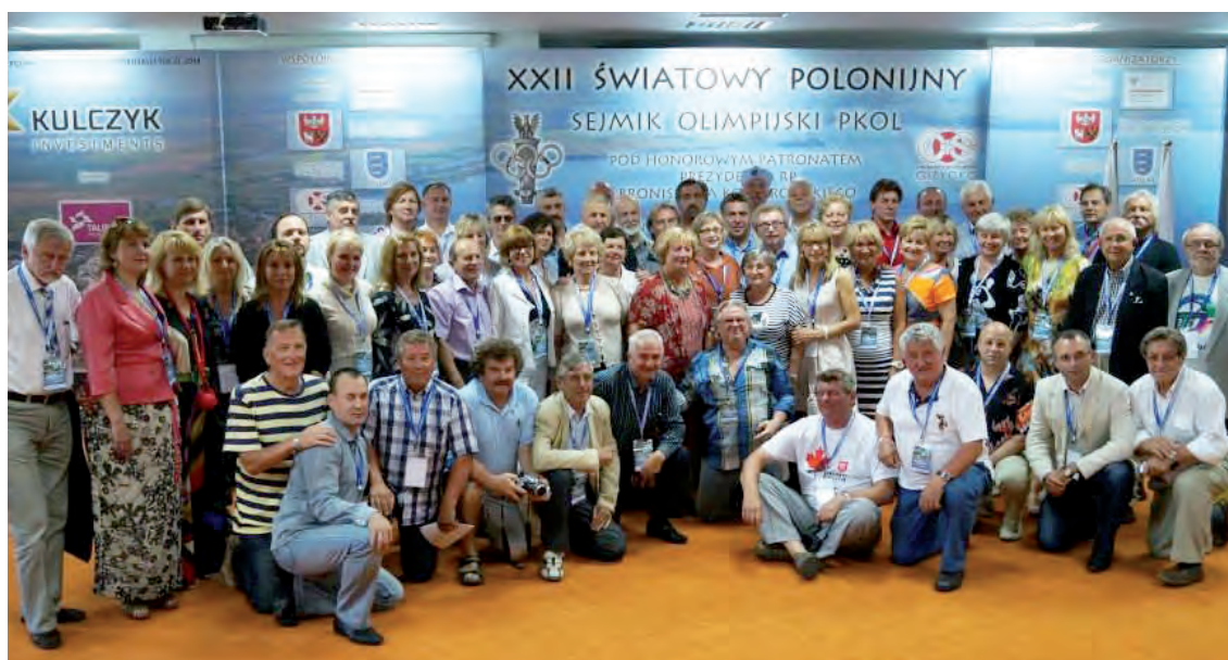
Uczestnicy na zakończeniu XXII Sejmiku Polonijnego.