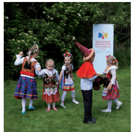
Maluchy z Kwiatów Polskich zatańczyły krakowianka.