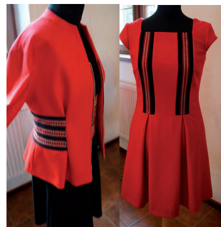
Perebor jako element dekoracyjny nowej kolekcji firmy Bielkan.