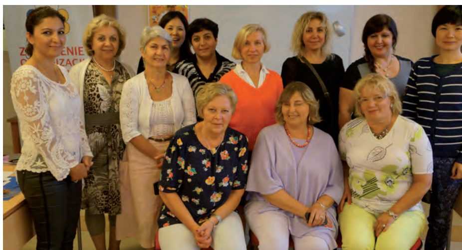
Uczestniczki zebrania rocznego SIOS KK, podczas którego zrodziło się wiele nowych pomysłów.

Te organizacje mogą stworzyć załączek i podstawę do stworzenia dużej sekcji kobiecej w Zrzeszeniu.