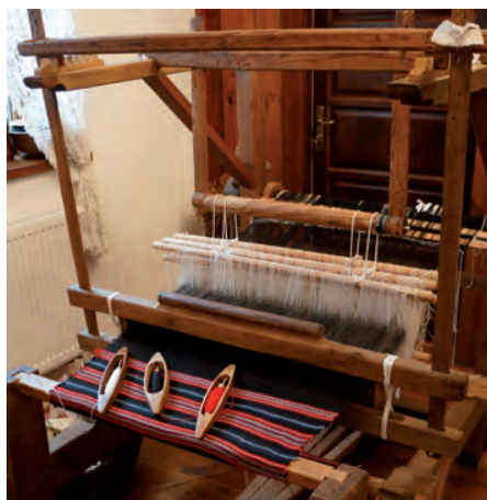
Perebor podlaski podczas tkania.

kulinarnej. Obok siebie możemy tutaj zobaczyć kościoły, cerkwie, synagogi i meczety. Do dzisiejszego dnia używana jest gwara zwaną językiem chachłackim. Na przykład, dziewczyna to „doczka”, ojciec – „batko”, wódka – „horyłka”, a co ode mnie chcesz to „szczo mene chcesz”. Podlasie jest ostoją dzikich zwierząt i roślin na skalę Polski i Europy. Jest jednym z najmniej zagospodarowanych przez człowieka i najmniej zanieczyszczonym regionem Polski bez uciążliwego przemysłu. Nic dziwnego więc, że osiedlają się tutaj zagrożone gatunki fauny. Żubry żyją w lasach Białowieży,