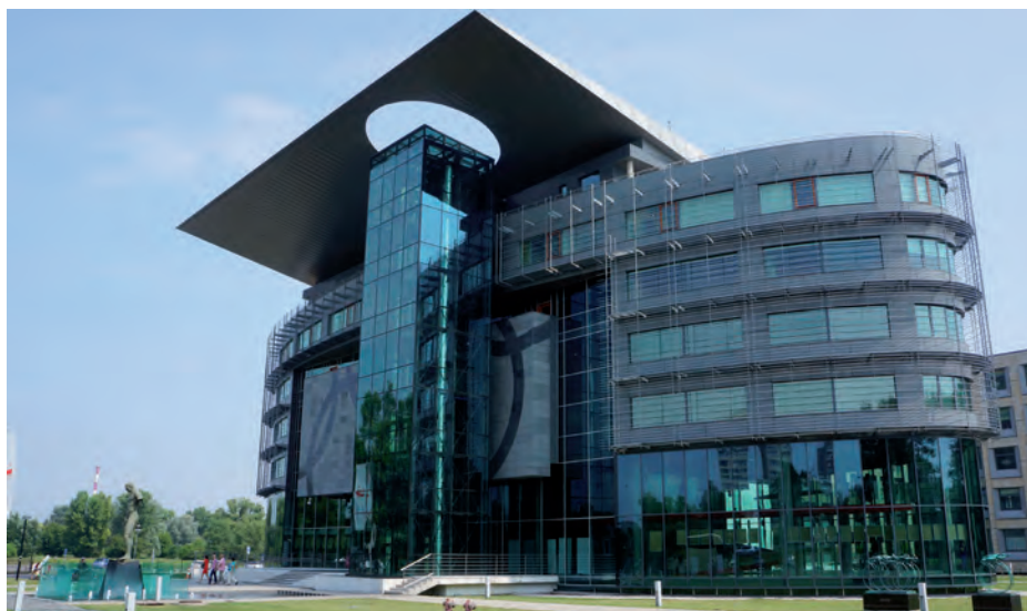
Główna siedziba Polskiego Komitetu Olimpijskiego w Warszawie.

Zadaniem tegorocznego Sejmiku było omówienie działalności organizacji polonijnych w obszarze sportu i kultury fizycznej oraz wymiana doświadczeń i ocena działalności polonijnej w okresie olimpijskim 2009-2012. Omawiano także wpływ sportu, kultury fizycznej i ruchu olimpijskiego na kreowanie liderów w pracy organizacji polonijnych. Wartością dodaną było poznanie regionu Warmii i Mazur jako "Krainy Tysiąca Jezior".