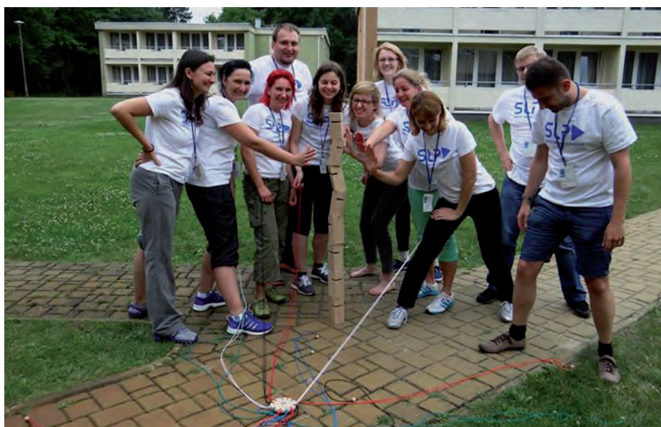
Zajęcia outdoorowe "Angażujący lider".