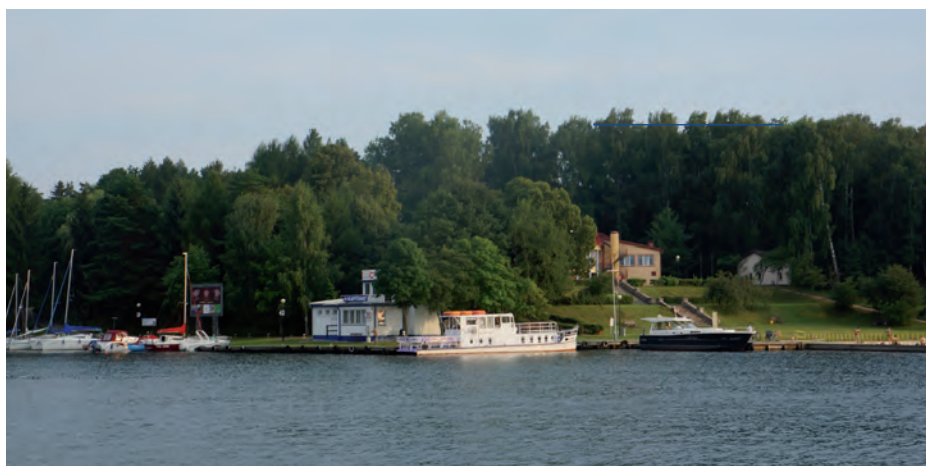
Centralny Ośrodek Sportu, Ośrodek Przygotowań Olimpijskich w Giżycku.