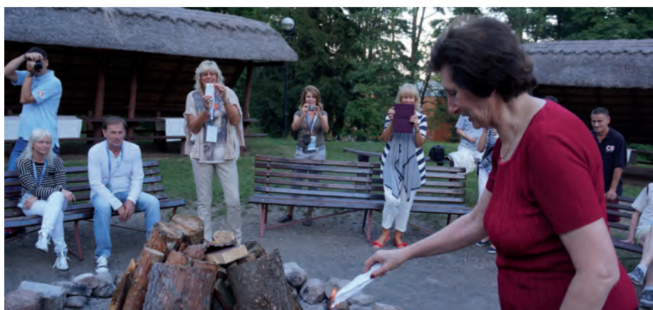
Irena Szewińska rozpałała ognisko, które w każdy wieczór towarzyszyło spotkaniom sejmikowym.