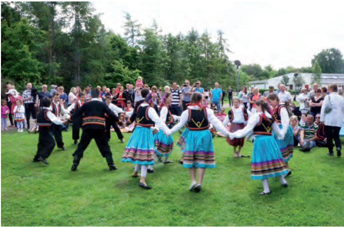
Dzieci ze średniej grupy Kwiatów Polskich zatańczyły na trawie.