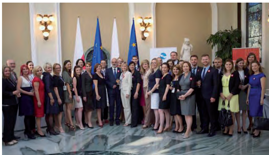
Wizyta absolwentów Szkoły Liderów w Pałacu Prezydenckim.

13-dniowy kurs rozpoczął się uroczystą inauguracją w Warszawie, w której wzięli udział Andrzej Person