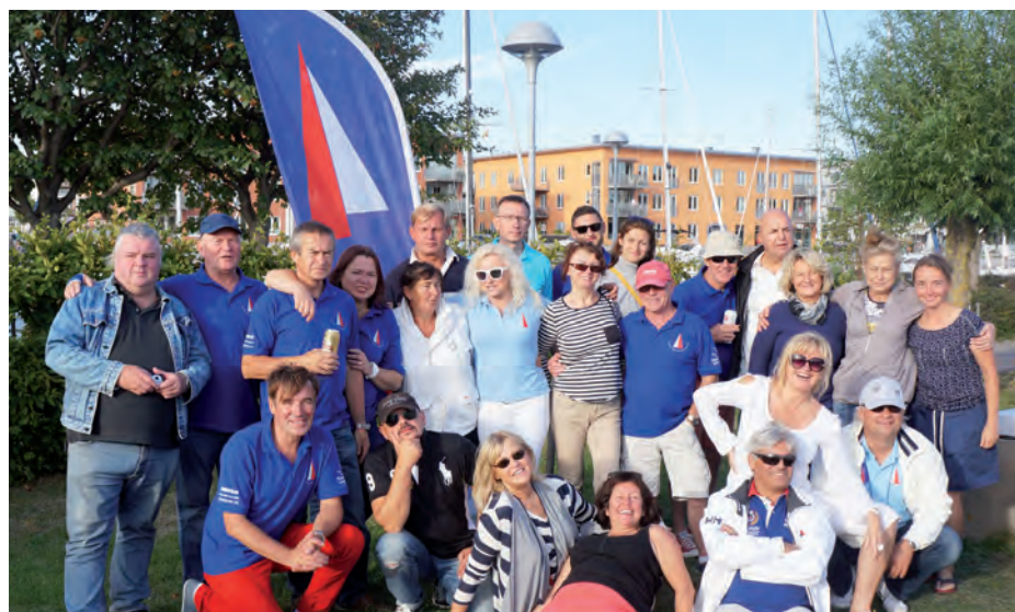
Przepis na udaną imprezę: piękna pogoda, udany rejs, wspólne śpiewanie i szampańskie humory członków Yacht Klub Polonia w Malmö.

żeglarskiego zorganizował rejs do portu w Lomma i wspólny grill.