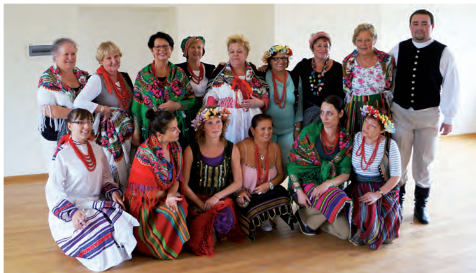
Po zajęciach tanecznych i zabawie "Z babcinego kufra".