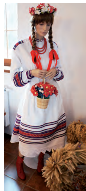
Strój ludowy z pereborem.