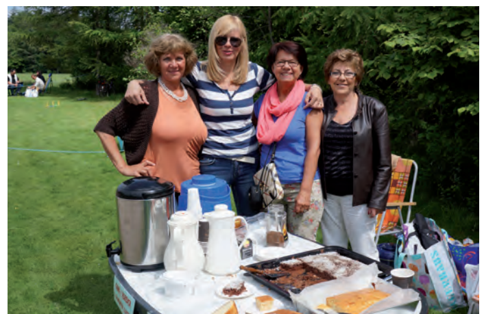
Klub Kobiet Kreatywnych zorganizował przepyszny bufet z kawą i ciastem.