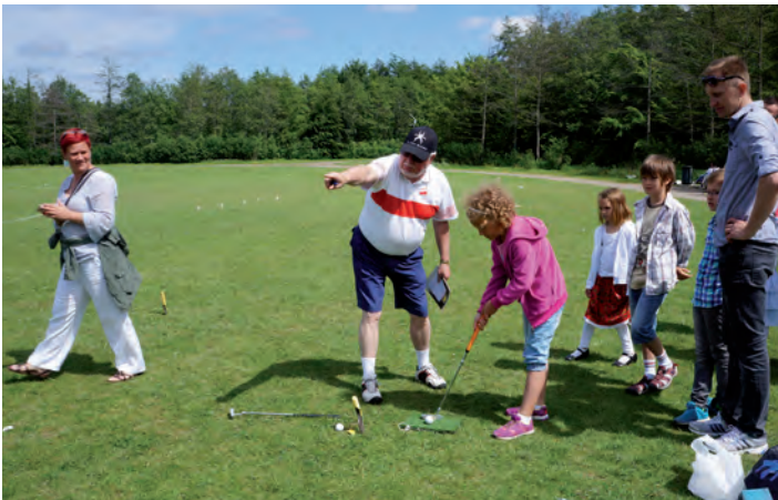
Do nauki gry w golfa trzeba się było zapisywać do kolejki.