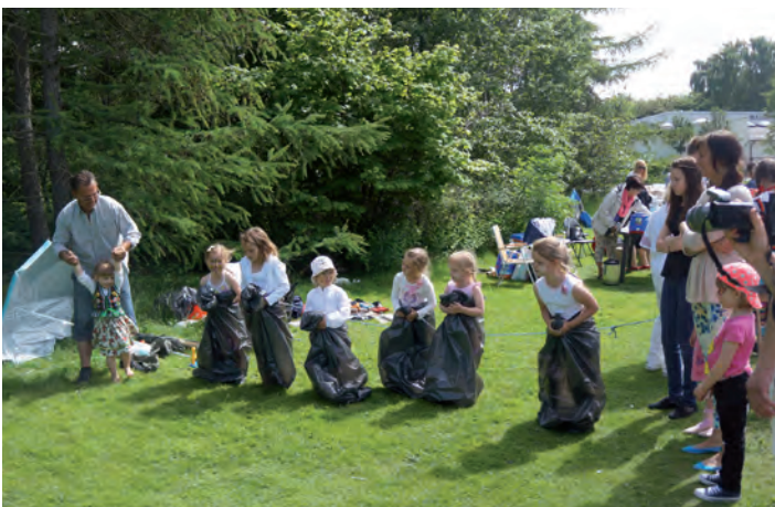
Biegi w workach cieszyły się dużym powodzeniem u dzieci.