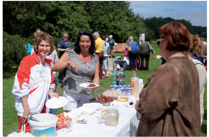
Do bufetu POCOSu z sałatkami i potrawami z grilla była długa kolejka.