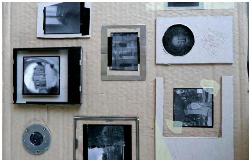
Zrobione zdjęcia przygotowywane na wystawę.