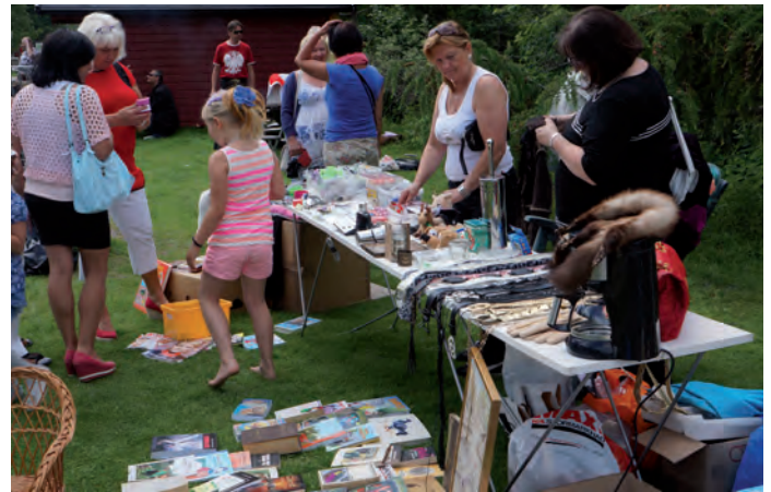
Na kiermaszu POLKI iść można było znaleźć wiele ciekawych rzeczy.