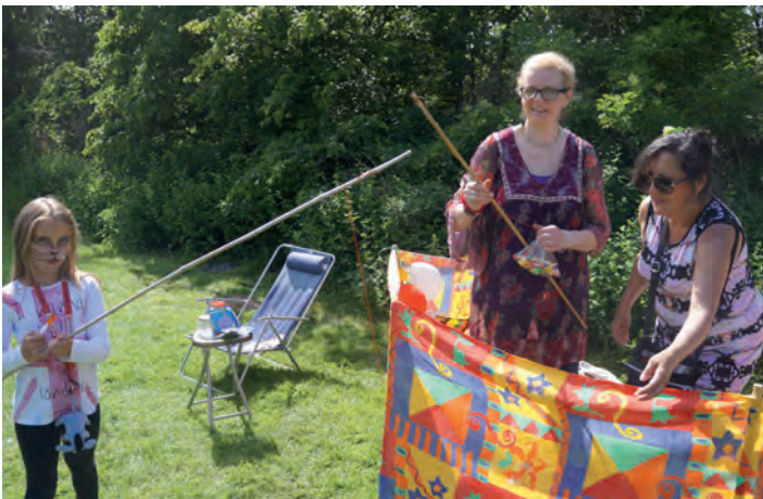
Wędkowanie słodyczy było popularne wśród dzieci.