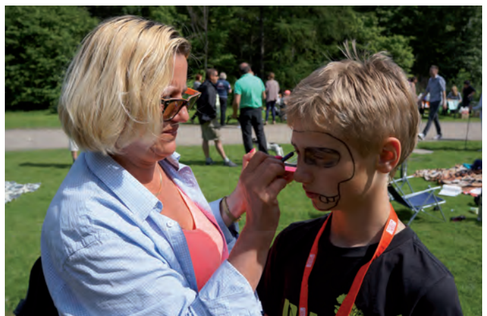
Wiele było wymalowanych twarzy tego dnia.