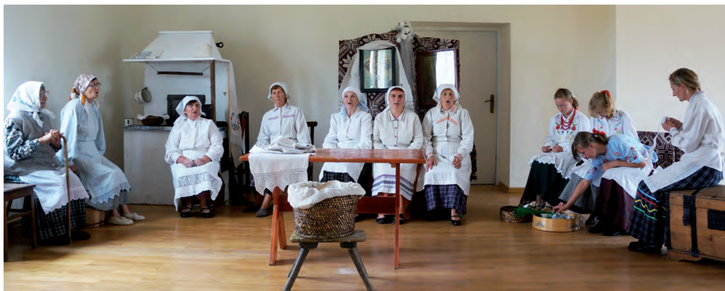
Widowisko obrzędowe "Pieczenie Korowaja".

dowej kultury i zachęcić do powrotu do korzeni Polonię z różnych krajów Unii Europejskiej.