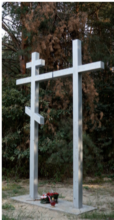
Jedno miejsce pamięci, dwie religie, dwa krzyże - nikogo na Podlasiu nie dziwią.

Zróżnicowana kultura ludowa Podlasia ukształtowała się dzięki spotkaniu i rozwojowi przez wieki odmiennych kultur i religii: polskiej, ukraińskiej, żydowskiej i tatarskiej. Rezultatem jest niezwykle bogata mozaika etniczna i regionalna kultura ludowa, która przejawia się w pieśni i tańcu, rzeźbie, tkactwie i sztuce