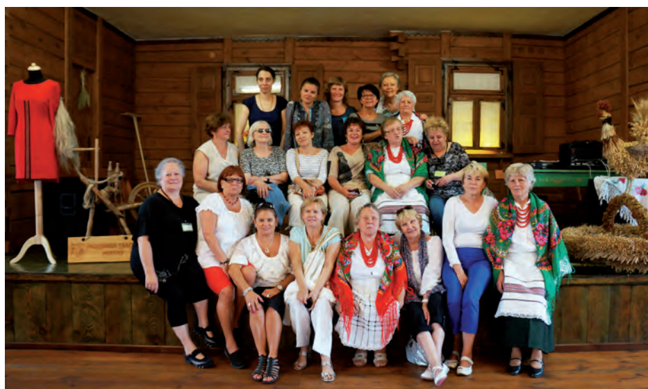
Uczestniczki warsztatów w Pracowni Tkackiej w Hrudzie.