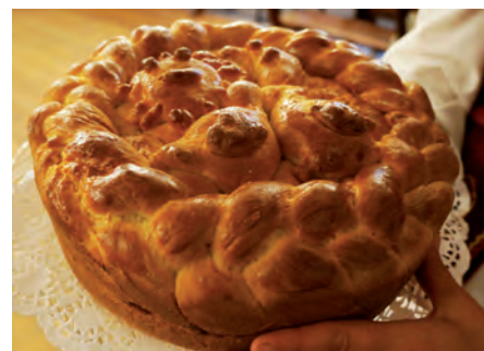
Upieczony przez nas korowaj.

kulinarnej. Obok siebie możemy tutaj zobaczyć kościoły, cerkwie, synagogi i meczety. Do dzisiejszego dnia używana jest gwara zwaną językiem chachłackim. Na przykład, dziewczyna to „doczka”, ojciec – „batko”, wódka – „horyłka”, a co ode mnie chcesz to „szczo mene chcesz”. Podlasie jest ostoją dzikich zwierząt i roślin na skalę Polski i Europy. Jest jednym z najmniej zagospodarowanych przez człowieka i najmniej zanieczyszczonym regionem Polski bez uciążliwego przemysłu. Nic dziwnego więc, że osiedlają się tutaj zagrożone gatunki fauny. Żubry żyją w lasach Białowieży,