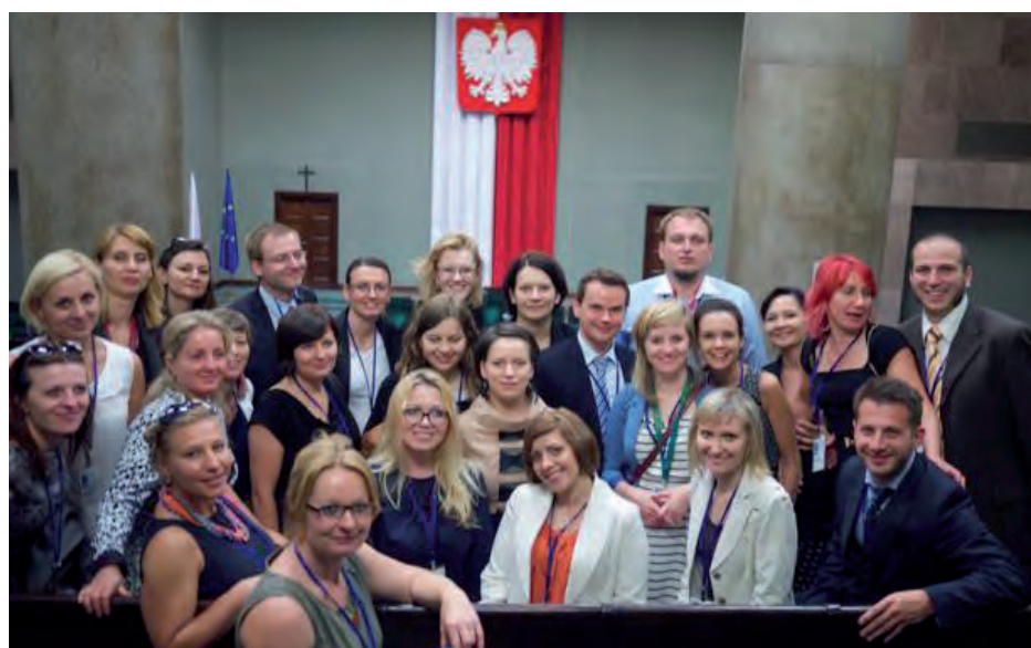
Wizyta w Sejmie.