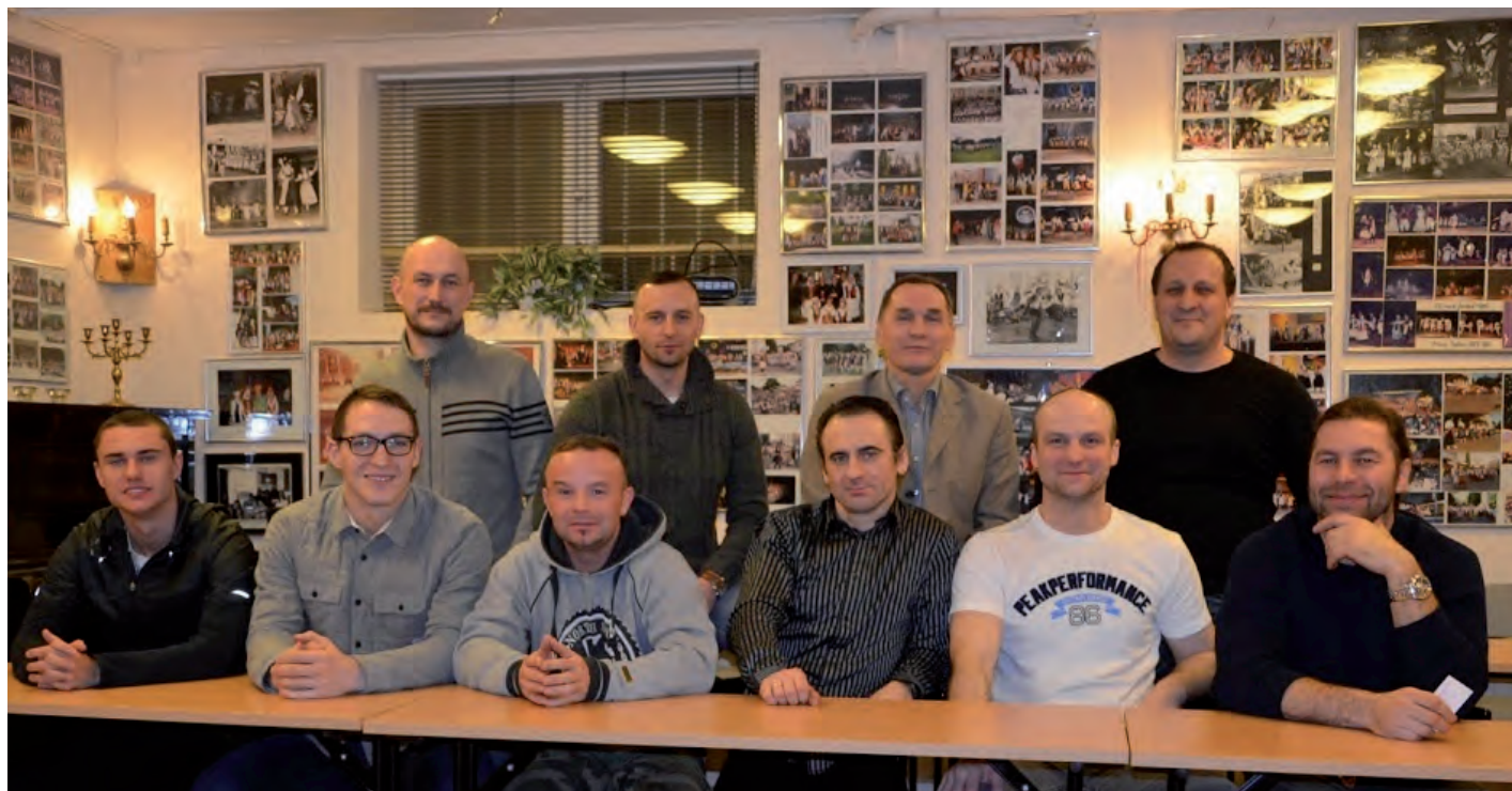
Aktyw Koła Związku Oficerów Rezerwy RP im. Marszałka Józefa Piłsudskiego.

Tekst MIECZYŚLAW HAPOŃSKI