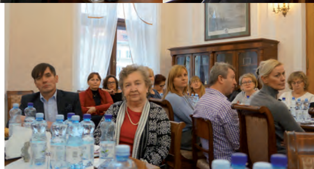
Prezesi organizacji Zrzeszenia Organizacji Polonijnych w Szwecji podczas obrad i konferencji w Sali Kominkowej w siedzibie Stowarzyszenia Wspólnota Polska w Warszawie.