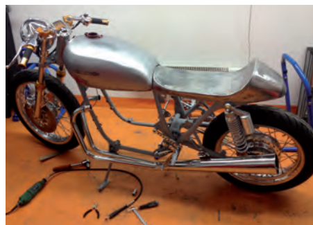
Po rozebraniu na czynniki pierwsze nastąpiła kolej na prace nad kształtem i wyglądem nowego pojazdu oraz polerowanie silnika.

Czas przeglądu. Nie było cienia wątpliwości, że będą jakieś niespodzianki. Pracownicy na przeglądzie byli zachwyceni tym jednośladem. Przegląd był nawet zaskoczeniem dla konstruktora, że wszystko było bez zastrzeżeń oprócz ustawienia przedniej lampy. Po przeglądzie motocykl odwiedził miejsce w którym spotykają się zwolennicy różnorakich przeróbek i twórczości konstruktorów. Honda została zauważona przez zainteresowanych obserwatorów oraz przez znane szwedzkie czasopismo Clasicbike.