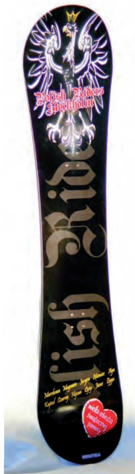
Piękna deska snowboardowa w wykonaniu Polish Riders Stockholm.