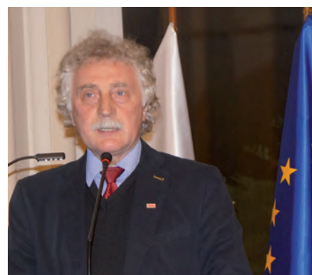
Prezes Stowarzyszenia Wspólnota Polska podkreślił wagę znajomości języka polskiego wśród dzieci przebywających na emigracji.

przeciwdziałającą wykluczeniu społecznemu migrantów.