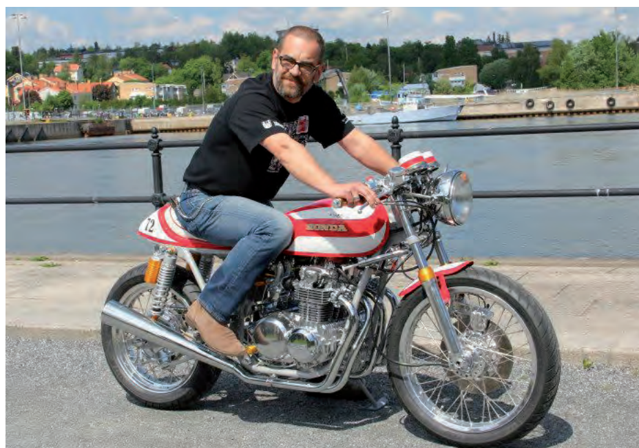
„Jezus” na pierwszej przejażdżce nowym, biało-czerwonym Cafe Express.