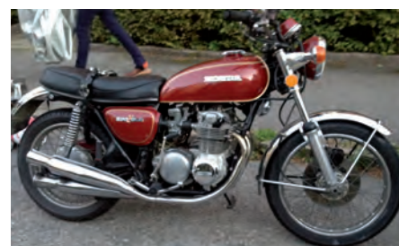
Tak wyglądał motocykl w oryginale.