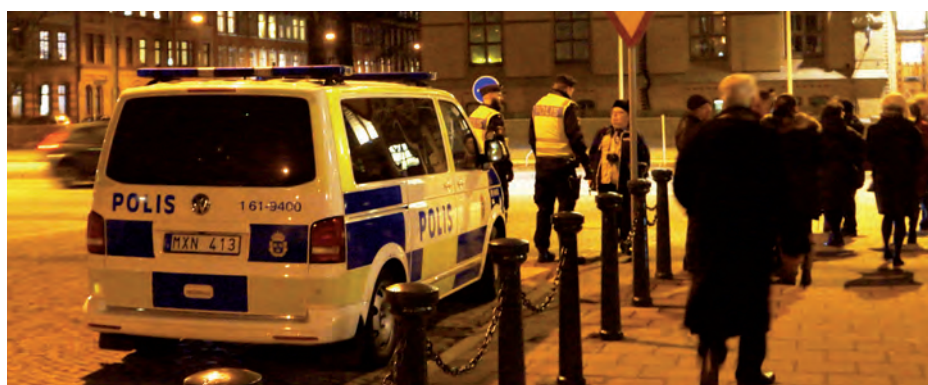
Fotografować można było tylko umundurowanych policjantów i służbowe samochody policyjne.