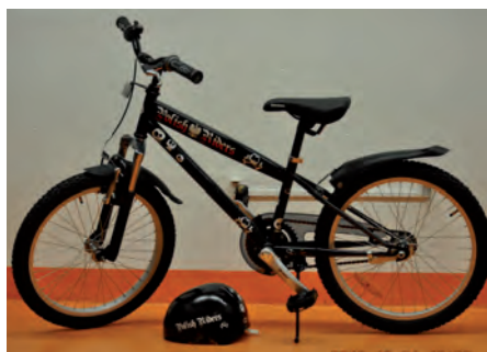
Dar na aukcję Wielkiej Orkiestry 2014 - rower górski i kask specjalnie pomalowane przez motocyklistów z Polish Riders Stockholm.

Podczas 22. Finału WOŚP, za cenę 2500 koron zlicytowano подарowany przez Polish Riders Stockholm rower górski Marvil Dirt, przemalowany przez klubowego malarza Jezusa. W tym roku Wielka Orkiestra w Szwecji