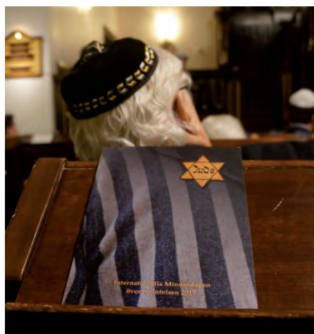
Program obchodów w swej graficznej szacie nawiązywał do tragicznych wydarzeń w obozach koncentracyjnych i przymusu noszenia żółtej gwiazdy.

Po wyjściu z synagogi zrobiłam kilka zdjęć pokazujących ochronę na zewnątrz, po czym od razu podszedł do mnie funkcjonariusz w cywilu i zażądał pokazania zrobionych zdjęć. Wszystkie oprócz jednego musiałam skasować gdyż nie wolno fotografować właśnie służb w cywilu.