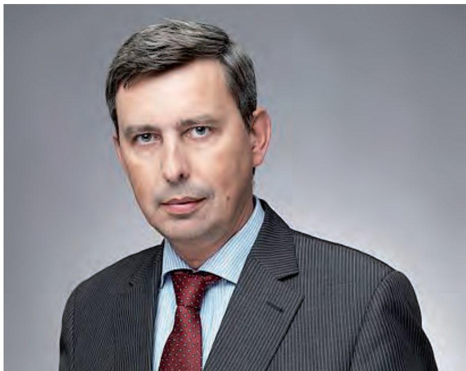
Wiesław Tarka jest nowym ambasadorem RP w Szwecji.

trów spraw zagranicznych Polski i Szwecji została podpisana Polsko-szwedzka Deklaracja o współpracy politycznej w obszarach o znaczeniu strategicznym.