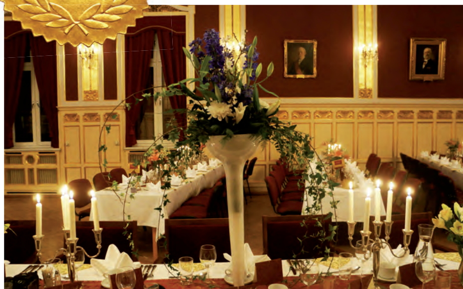
Piękna sala Łoży Masońskiej przy Stortorget na chwilę przed wejściem gości Balu Polonii 2015.