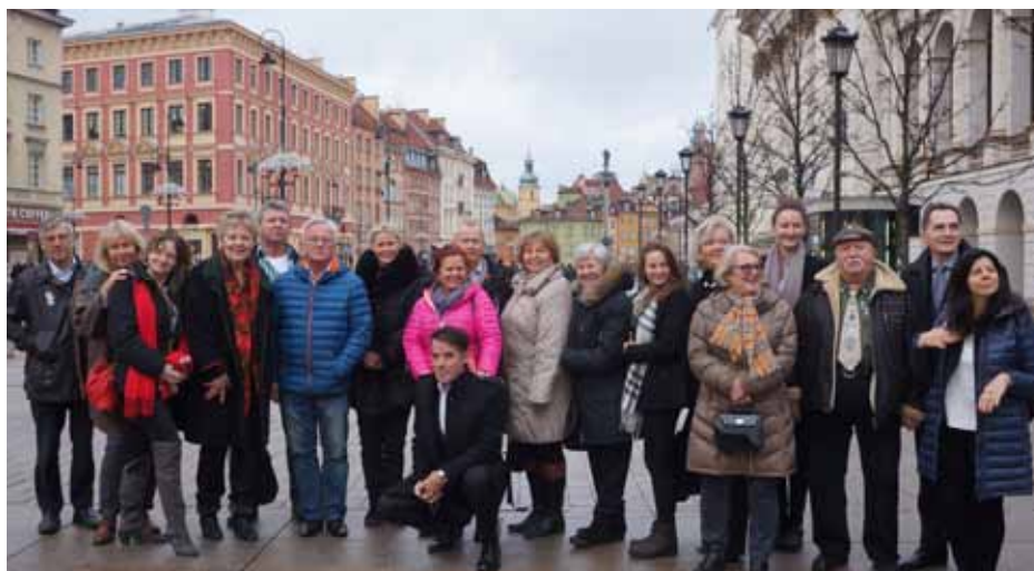
Uczestnicy spotkania przed Domem Polonii na Krakowskim Przedmieściu w Warszawie.