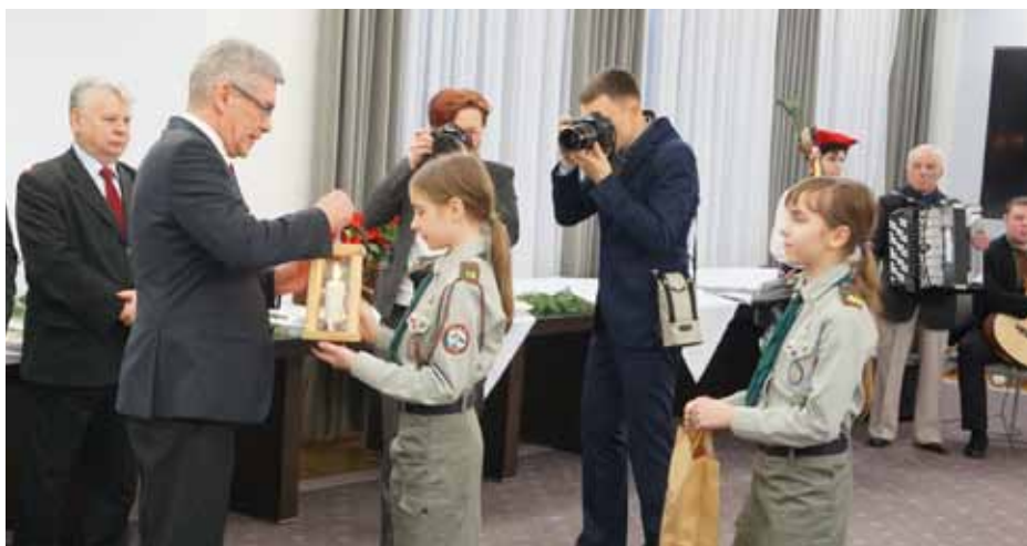
Harcerze przekazali marszałkowi Senatu tradycyjne światelko betlejemskie.