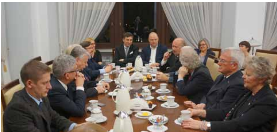
W dyskusji poruszono wiele ważnych aspektów przyszłej współpracy Senatu z Polonią.

Europejskie Forum Mediów Polonijnych, które zaowocowało współpracą i powstaniem wspólnego portalu dla mediów.