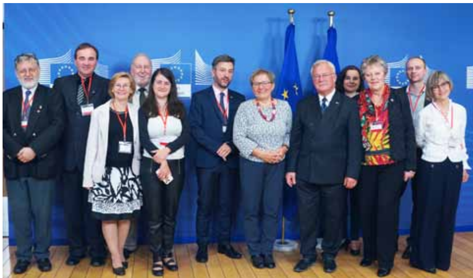
Część uczestników konferencji zwiedziła siedzibę Komisji Europejskiej w Brukseli.

unijnych dotyczących monitorowania migracji w UE;