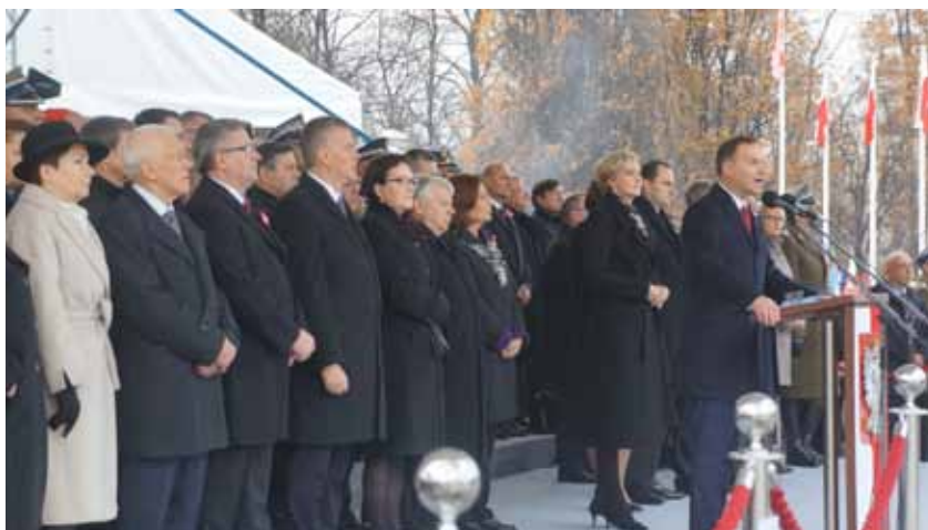
Prezydent RP Andrzej Duda podczas uroczystości obchodów Święta Narodowego na Placu Piłsudskiego.