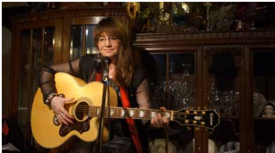
Recital Danuty Zasady - „Nuty Niepokornej” w klubie „La Boheme”.

Z nadzieją na łut szczęścia absorbując przestrzeń mówimy o polskości zawsze jednym głosem choć każdy po swojemu, ja np. wierszem bo każdy z nas to przecież ojczyźniany poseł.