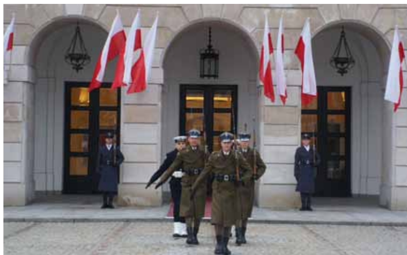
Na przyjęcie w Pałacu Prezydenckim z okazji Święta Niepodległości Prezydent RP zaprosił m.in. przedstawicieli korpusu dyplomatycznego i działaczy polonijnych.