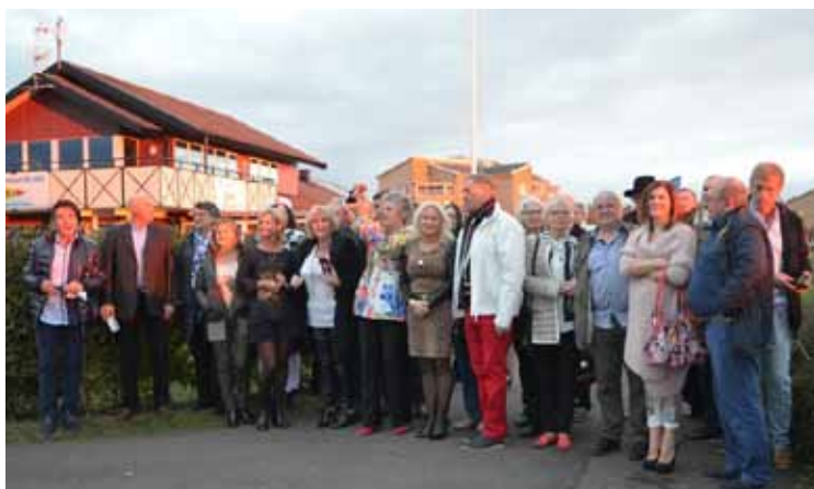
Na zakończenie sezonu żeglarskiego przybyli licznie członkowie i sympatycy Yacht Klubu Polonia Skandynawia.