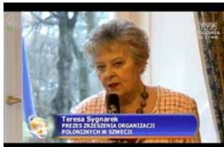
TVP Polonia zamieściła w swoim programie reportaż z Europejskiego Forum Mediów Polonijnych.