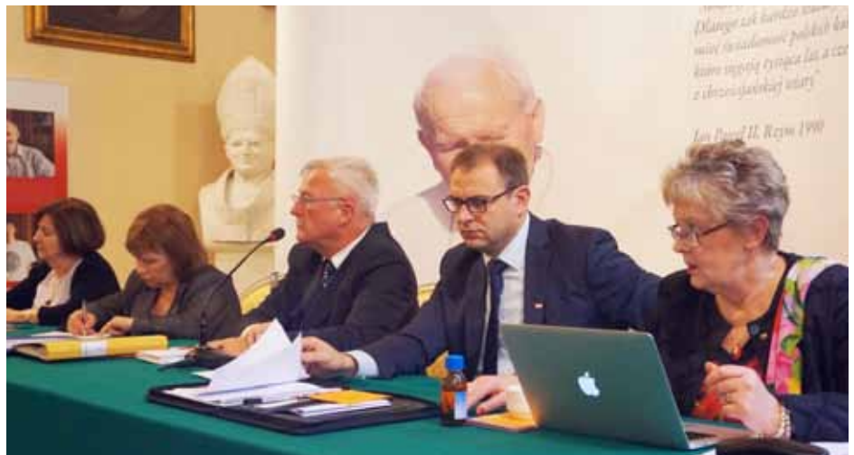
Podium IX Zjazdu EUWP.