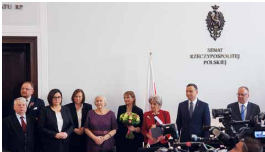
Prezydent Andrzej Duda wziął udział w otwarciu wystawy w gmachu Senatu.