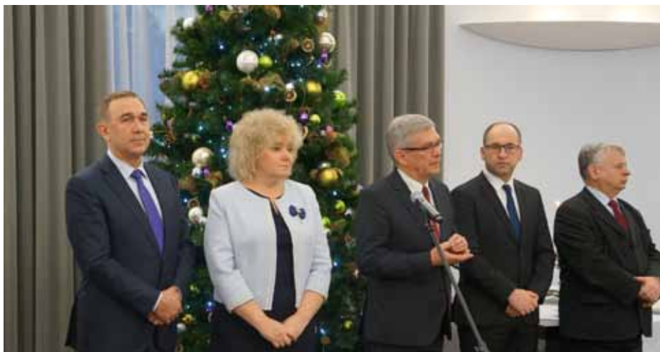
Gości przywitał marszałek Senatu RP Stanisław Karczewski.