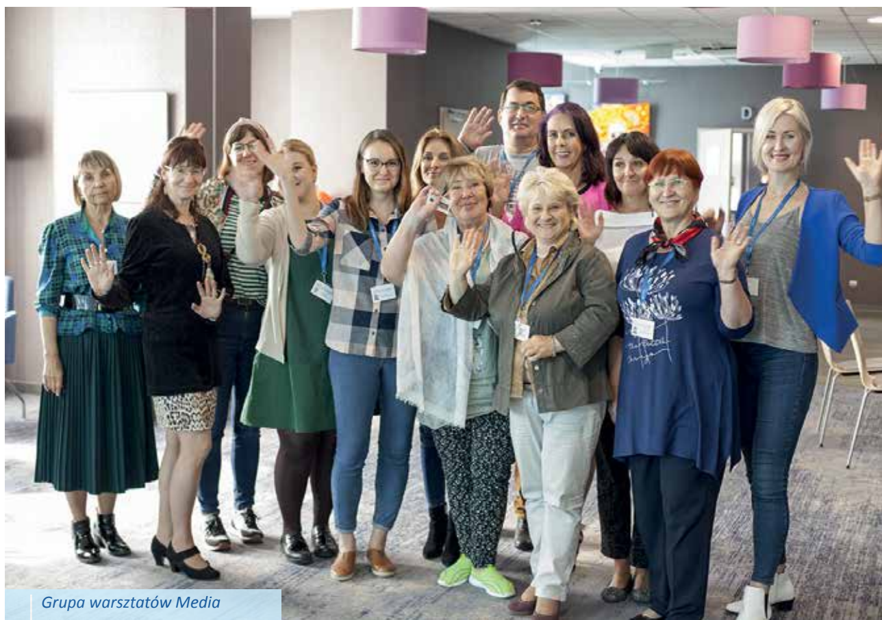
Grupa warsztatów Media drukowane