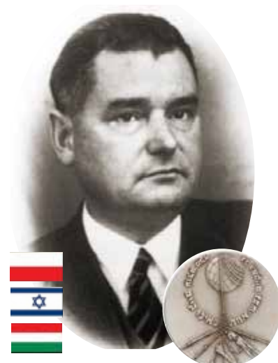
Henryk Sławik uhonorowany medalem „Sprawiedliwy wśród Narodów Świata” / Henryk Sławik hedrad med medaljen “Rättfärdig bland nationerna”.