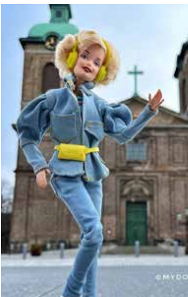
Przed kościołem Sofia Albertina w Landskronie.