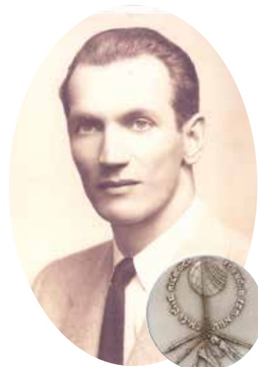
Jan Karski uhonorowany medalem „Sprawiedliwy wśród Narodów Świata” / Jan Karski hedrad med medaljen “Rättfärdig bland nationerna”.

Podczas spotkania z prezydentem Rooseveltem w 1943 r. Karski przedstawił dowody planowej polityki wyniszczania narodu polskiego oraz zagłady narodu żydowskiego. Proponował wystosowanie ultimatum wielkich mocarstw wobec Niemiec, że jeżeli nie zaprzestaną mordu na Żydach, zbombardowane zostaną ich miasta. Innym rozwiązaniem byłoby bombardowanie linii kolejowych do obozów zagłady lub dostarczanie broni, pieniędzy oraz paszportów partyzantom i uciekającym przed zagładą Żydom.