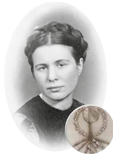
Irena Sendler uhonorowana medalem „Sprawiedliwy wśród Narodów Świata” / Irena Sendler hedrad med medaljen “Rättfärdig bland nationerna”.