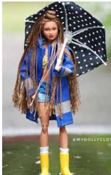
Deszcz nie straszny dla Barbie z parasolem i w kaloszkach.