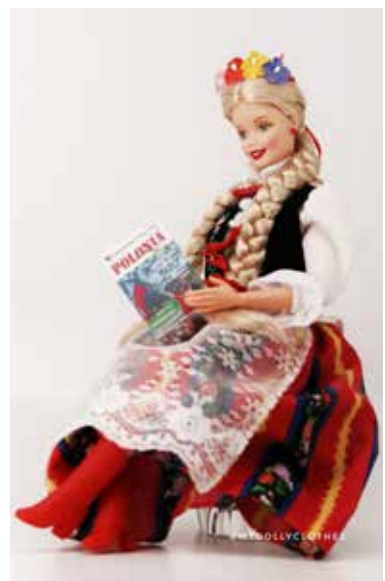
Barbie zaprasza do lektury kwartalnika Polonia Nowa.

Zdjęcia © Sława Schmelich - mydollyclothes