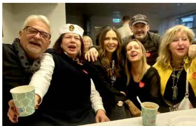
Yacht Klub Polonia Skandynawia w towarzystwie Mai Sablewskiej.