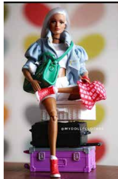
Barbie przed podróżą.