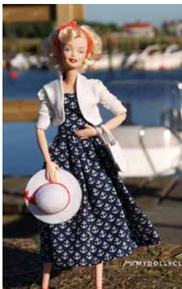
Z wizytą w porcie jachtowym.