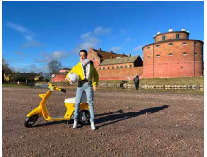
Zdjęcie do projektu „Travelling Doll Pants”. Barbie w dżinsach przechodnich na tle Cytadeli w Landskronie.