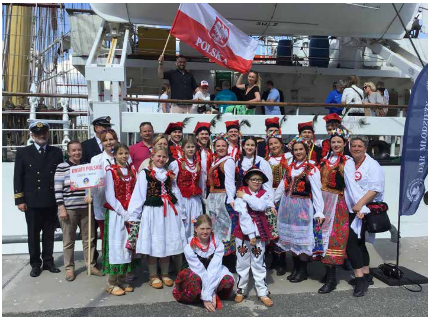
„Kwiaty Polskie” przed żaglowcem „Dar Młodzieży”. / „Kwiaty Polskie” framför segelfartyget.